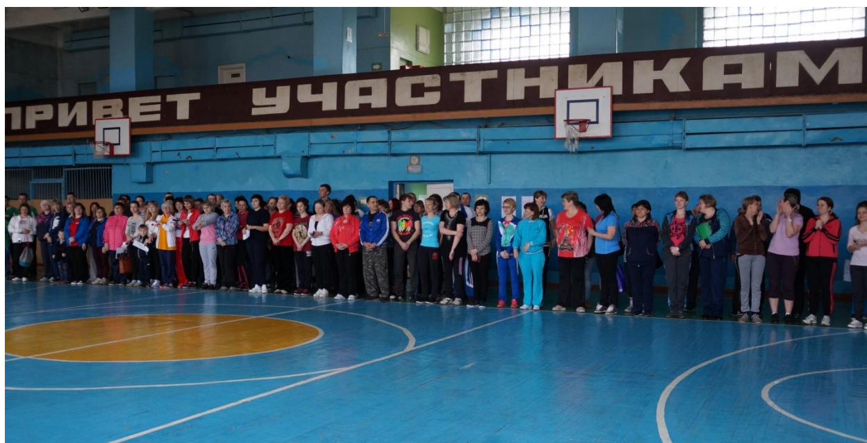
Участники спортивного праздника во время общего построения.

18 марта 2017 года двери МБУ ДО ДЮСШ г.Грязи распахнулись для всех жителей нашего района, пожелавших приобщиться к общероссийскому спортивному движению. Несмотря на массовость, мероприятие прошло на высоком уровне, чему в немалой степени способствовала серьезная подготовительная работа. Во-первых, информация о событии была заблаговременно размещена на официальном сайте детско-юношеской спортивной школы (в нескольких разделах) и на страницах районной газеты «Грязинские известия». Во-вторых, было проведено оперативное совещание судейской бригады, на котором обсуждались нюансы приема нормативов среди взрослого населения (к примеру, вид «Сгибание и разгибание рук» имеет три вариации в IX, X и XI ступенях комплекса ВФСК ГТО). В-третьих, в рамках межведомственного взаимодействия согласовывались вопросы оказания медицинской помощи и музыкального сопровождения.